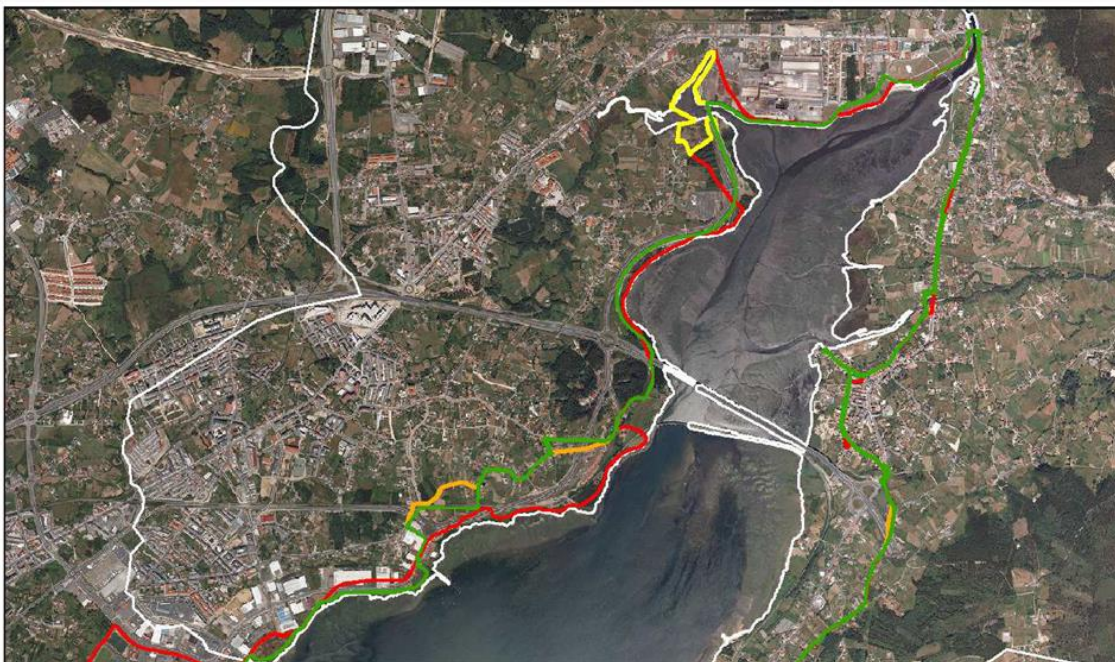
Superposición do trazado de 1997 e trazados do Camiño, complementario e trazado con vestixios históricos Narón.